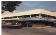
Antigua sede de la Escuela Judicial ubicada en Avenida Balboa

La Escuela Judicial de Panamá fue instituida en virtud del Código Judicial, artículo 2633 del que faculta al Pleno de la Corte Suprema de Justicia de Panamá, para todo lo relacionado a su organización, reglamentación y funcionamiento.